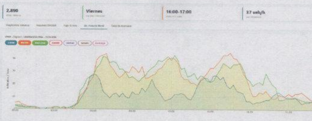
Figura 7. VHM – Dígito 1 – UNIMAGDALENA – 2026-W16